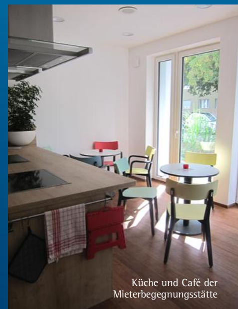
Küche und Café der Mieterbegegnungsstätte