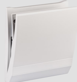
Innenblende Kunststoff 9/IBK