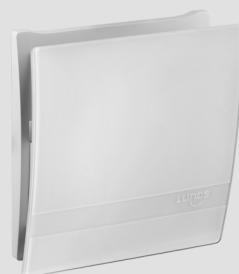
Innenblende Glas 9/IBG