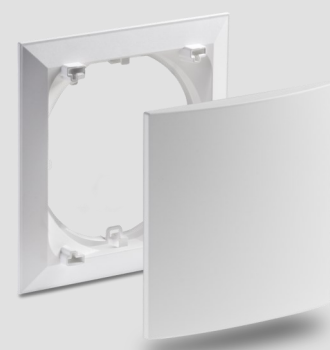
Innenblende Kunststoff 9/IBE

Produkte und deren Abbildungen können leicht variieren. Aufgrund ständiger Weiterentwicklungen und/oder mehrerer Lieferanten für z.B. Rohmaterialien können u.a. Farben leicht variieren oder auf Prospekten unterschiedlich dargestellt werden.